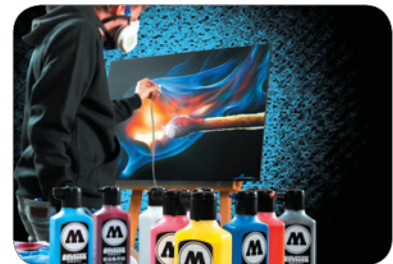
Airbrush-Anwendungen: ONE4ALL™ Refills lassen sich problemlos mit Wasser oder Aceton verdünnen und untereinander mischen – perfekt für Airbrusher Airbrush applications: ONE4ALL™ Refills can easily be diluted with water or acetone and are intermixable – perfect for airbrush artists