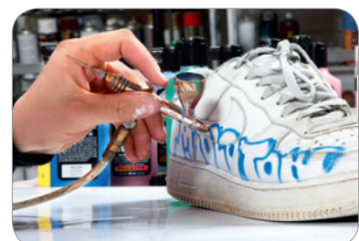
100% Deckkraft – mit ONE4ALL™ Refill lassen sich nahezu alle Materialien und Oberflächen bearbeiten – Stein, Metal, Kunststoffe, Holz, Textilien, Leinwand, Schuhe und vieles mehr 100% covering power – ONE4ALL™ Refills can be applied on almost every material or surface – stone, metal, plastics, wood, textiles, canvas, shoes and many more