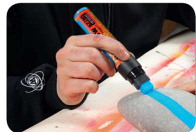
ONE4ALL™ Refills lassen sich problemlos mit jedem Auftragswerkzeug verarbeiten – egal ob Pinsel, Schwamm oder Marker ONE4ALL™ Refills can easily be used with every application tool – whether it's a brush, a sponge or a marker