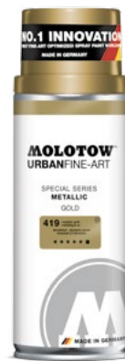
337.993 METALLIC 400 ml 2 colors