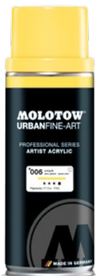
337.700 ARTIST ACRYLIC 400 ml 48 colors