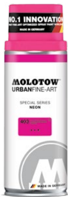
337.300 NEON 400 ml 5 colors