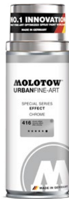
337.992 EFFECT 400 ml 3 colors