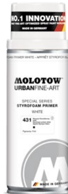
337.320 STYROFOAM PRIMER 400 ml