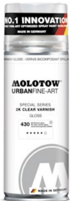
337.319 2K CLEAR VARNISH 400 ml