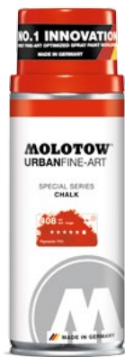
337.700 CHALK 400 ml 10 colors