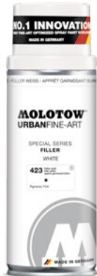
337.313 FILLER 400 ml