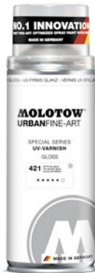
337.995 UV-VARNISH 400 ml