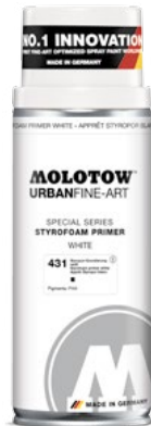
337.320 STYROFOAM PRIMER 400 ml