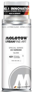
337.995 UV-VARNISH 400 ml