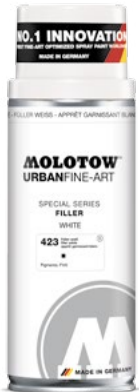
337.313 FILLER 400 ml