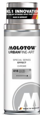
337.992 EFFECT 400 ml 3 colors