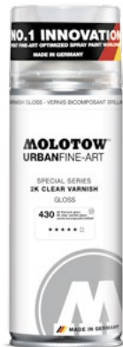
337.319 2K CLEAR VARNISH 400 ml