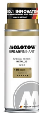
337.993 METALLIC 400 ml 2 colors