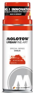
337.700 CHALK 400 ml 10 colors