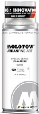
337.995 UV-VARNISH 400 ml