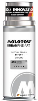
337.992 EFFECT 400 ml 3 colors