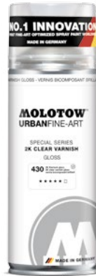
337.319 2K CLEAR VARNISH 400 ml