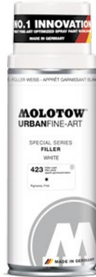
337.313 FILLER 400 ml