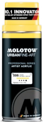
337.700 ARTIST ACRYLIC 400 ml 48 colors