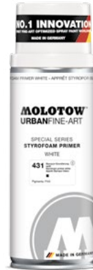
337.320 STYROFOAM PRIMER 400 ml