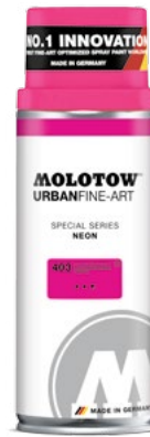
337.300 NEON 400 ml 5 colors