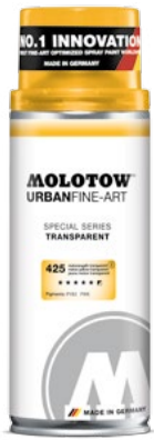
337.994 TRANSPARENT 400 ml 5 colors