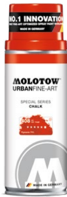
337.700 CHALK 400 ml 10 colors